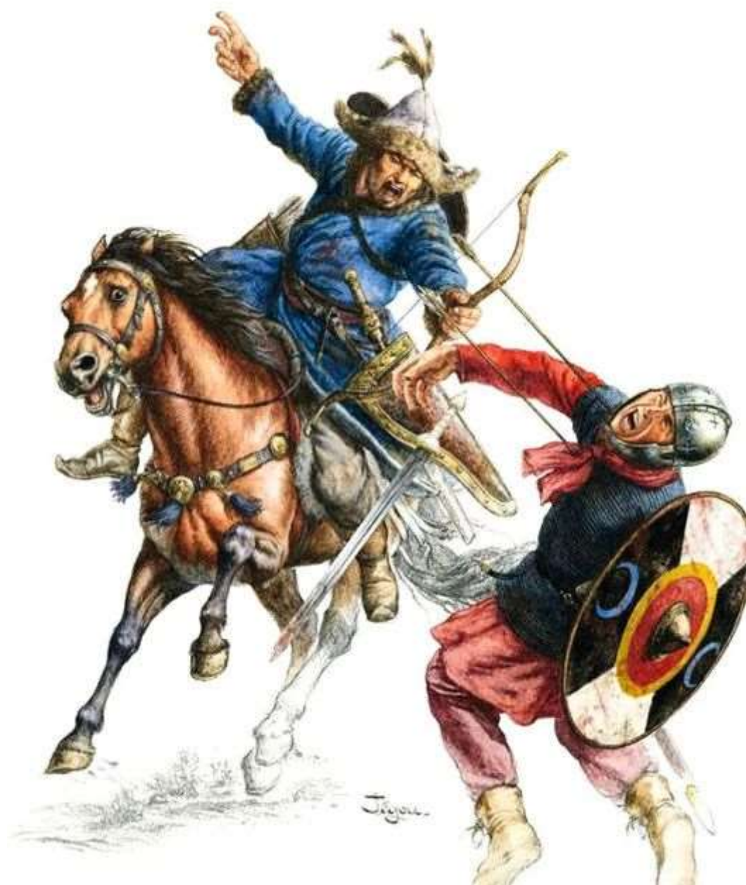
Түнгі шабуыл. Македондықтардың алдыңғы жасағының шегінуі

шеберлігін күтпесе керек. Бұл оған сабасына келуіне себеп болған шығар. Мұндай қарсыласу оның жоспарына әсер етті. Сол кезеңде ол аңызға айналған байлыққа толы Үнді жорығына дайындалып жатқан болатын. Ал бұл жерде ол тек жас Шу хақанды қуып жүріп, түркілердің (сақтардың) жаңадан жаулап алған иеліктеріне шабуыл жасау ниетінен айнытқысы келген еді. Алайда түрк (сақ) атты әскерінің әскери шеберлігін көріп, ол мұндай жеңісті оңайлықпен ала алмайтынын түсінген секілді. Керісінше, Үнді жорығында қажетке жарайтын ең үздік сарбаздарының бір бөлігінен айырылып қалуы мүмкін екенін аңғарды.