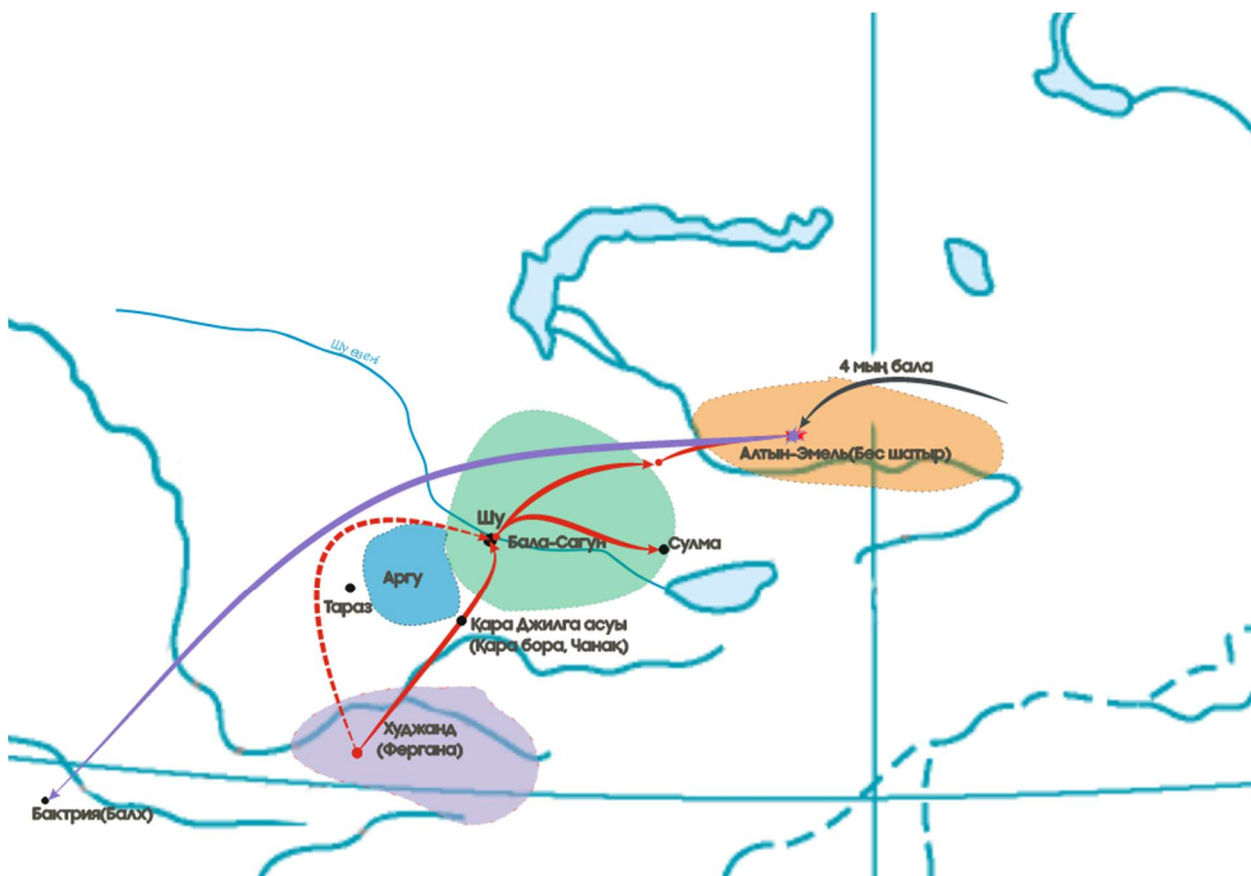
Зулқарнайын жасағының шеру жолдары

Лингвистердің пікірінше, Ескендір Зұлқарнайын дәуірінде парсы тілі емес, көне парсы тілі (авестийше) қолданылған. Кейінірек қазіргі фарси пайда болған. Ескендірдің өзге тілдерді меңгергені туралы нақты дәлелдер жоқ, сондықтан оның жанында аудармашылар когортасы (тобы) болған. Атап айтқанда, Бактрияда қызмет еткен ең белгілі аудармашы – Фарнук.